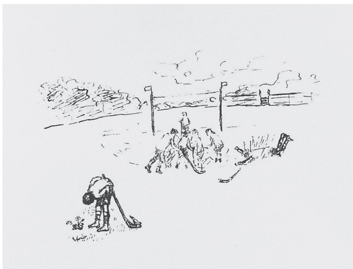
Le jeune Turing regardant pousser les fleurs pendant un match de hockey. Dessin réalisé par sa mère, Sara Turing, en 1923